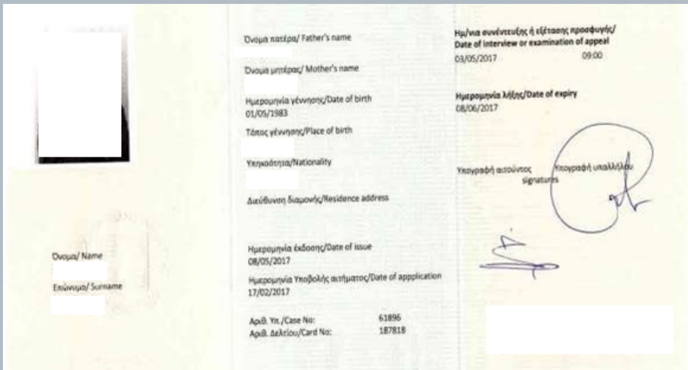
Εικόνα 3. Δείγμα Δελτίου Αιτούντος Άσυλο (παλιό)